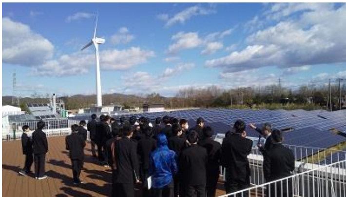
・産業技術総合研究所(福島再生可能エネルギー研究所)