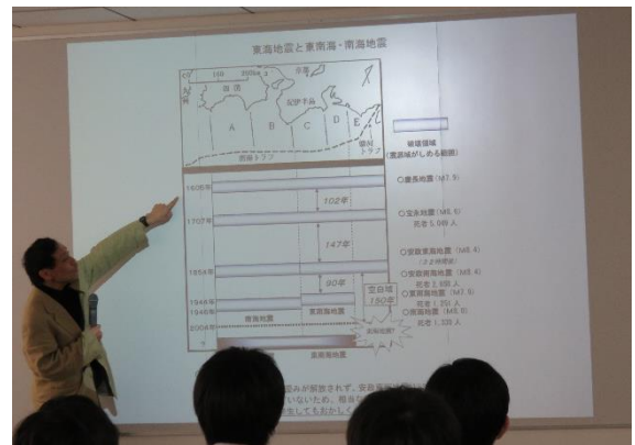
・東京大学 地震研究所