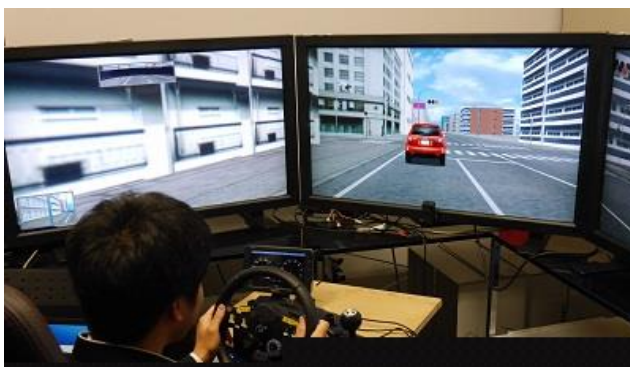
・早稲田大学(フロンティアセンター)