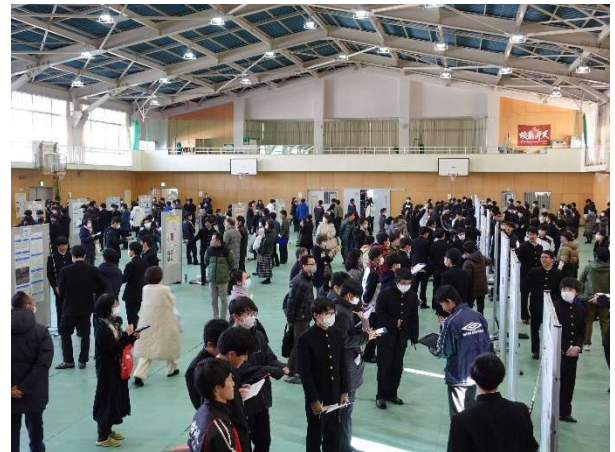
▲体育館会場の様子